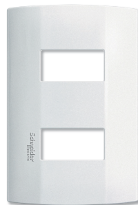
Placa 2 ventanas