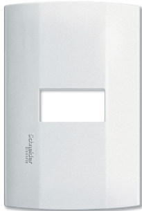
Placa 1 módulo