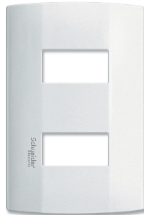
Placa 2 módulos