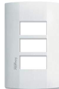
Placa 3 ventanas