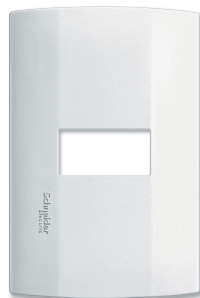
Placa 1 ventana