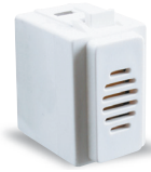
Zumbador 70 dB