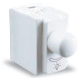
Dimmer 300 W para lámparas incandescentes y halógenas