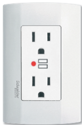
Toma dúplex 2P+T GFCI con placa