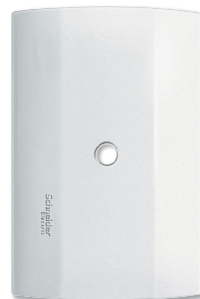
Placa con pre-corte