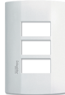
Placa 3 módulos